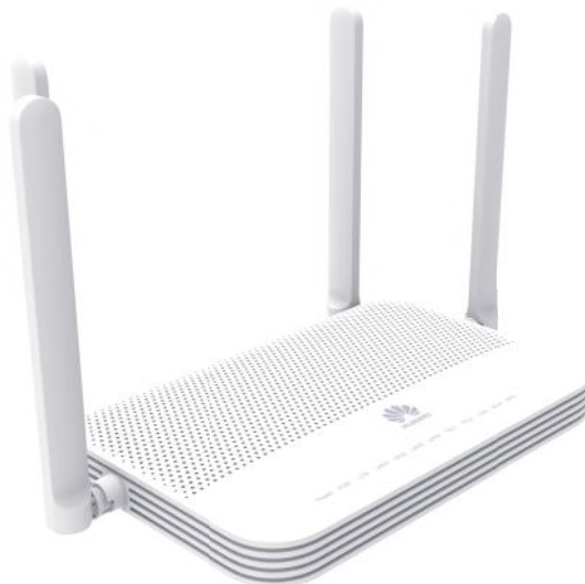
Obrázok č. 12 – konvertor Huawei EchoLife HG8245W5

Ak máte konvertor zobrazený na obrázku č. 12, postupujte takto: