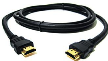
Obrázok č. 4 – HDMI kábel

Set-top box sa k televízoru pripája pomocou HDMI kábla (obr. č. 4) alebo SCART kábla (obr. č. 5).