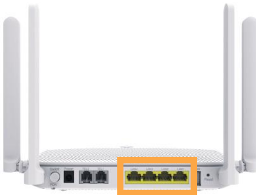
Obrázok č. 13 – pohľad na výstupy konvertora