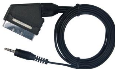
Obrázok č. 5 – A/V-SCART kábel