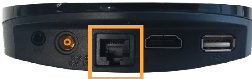
Obrázok č. 11 – Arris, vstup na pripojenie ethernetového kábla