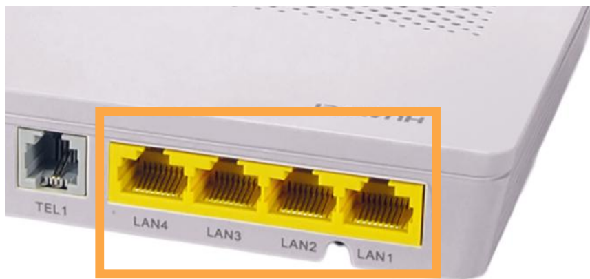
Obrázok č. 7 – pohľad na výstupy konvertora