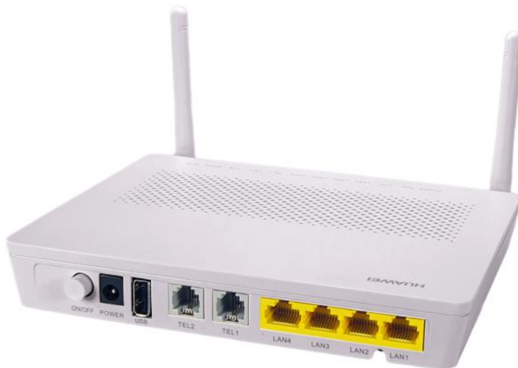
Obrázok č. 6 – konvertor Huawei EchoLife HG8245H

Ak máte konvertor zobrazený na obrázku č. 6, postupujte takto: