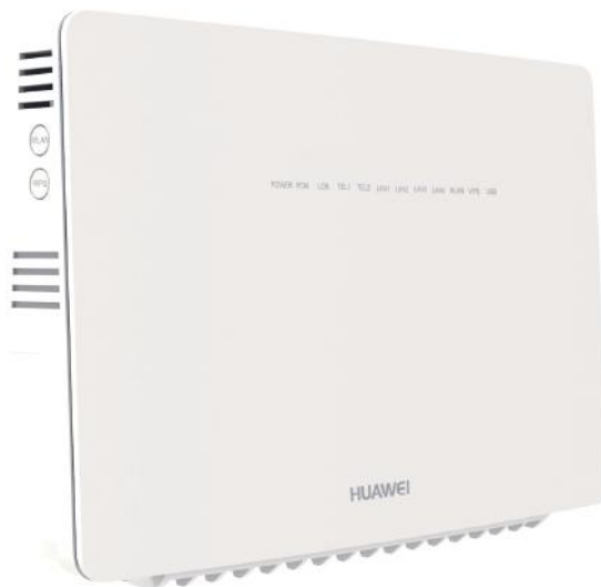
Obrázok č. 9 – konvertor Huawei EchoLife HG8245U

Ak máte konvertor zobrazený na obrázku č. 9, postupujte takto: