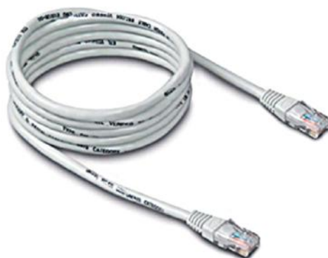
Obrázok č. 2 – ethernetový LAN kábel

Pre správnu funkciu zariadenia je potrebné mať aktivovanú službu Orange TV na optike. Set-top box sa pripája k optickému konvertoru (prevodníku optického signálu) pomocou ethernetového LAN kábla kategórie 5 (obr. č. 2), resp. pomocou špeciálnych Power line adaptérov (obr. č. 3), ktoré prenášajú signál po klasickej elektrickej sieti v domácnosti.