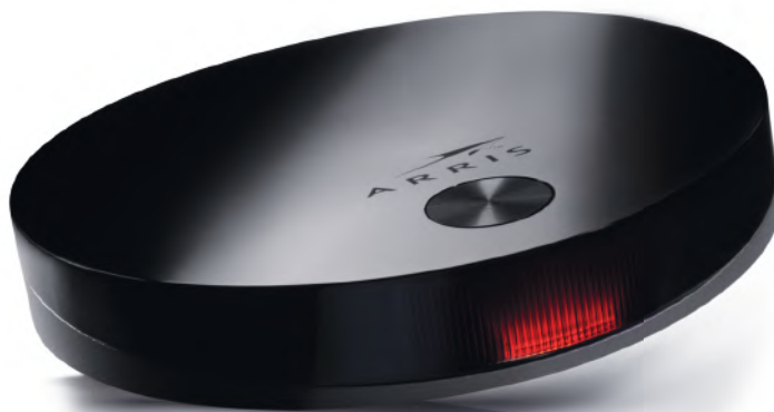
Obrázok č. 1 – Arris 4302M